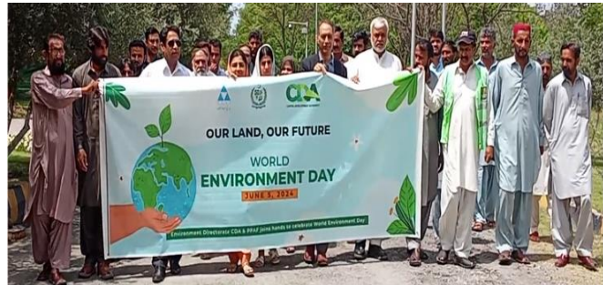
Islamabad: Celebrating World Environment Day 2024; Pakistan Poverty Alleviation Fund (PPAF) and Environment Directorate of Capital Development Authority (CDA) Islamabad jointly organized a walk to raise awareness on climate change.

An awareness walk was organized to engage the community and emphasize the significance of environmental conservation. Participants included local residents, PPAF staff, and volunteers, all coming together to demonstrate their commitment to protecting the environment. The walk was widely covered in national and regional newspapers, with captioned photographs highlighting the community's active participation.