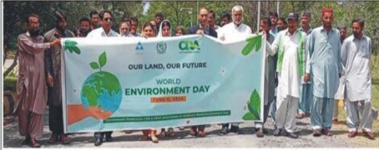
اسلام آباد: عالمی یوم ماحولیات کے موقع پر پاکستان پاورٹی الیویشن فنڈ (PPAF) اور کیمپنل ڈائریکٹوریٹ (CDA) اسلام آباد کے ماحولیات ڈائریکٹوریٹ نے موسمیاتی تبدیلی کے بارے میں شعور اجاگر کرنے کے لئے مشترکہ طور پر ایک واک کا اہتمام کیا۔

اسلام آباد سی ڈی اے اور پی پی اے ایف کی جانب سے مشترکہ واک کا اہتمام واک ماحولیات ڈائریکٹوریٹ نے موسمیاتی تبدیلی کے بارے میں شعور اجاگر کرنے کیلئے کی اسلام آباد (شازیب طاہر سے) کیمپنل واک ماحولیات ڈائریکٹوریٹ نے موسمیاتی اقتدارتی اسلام آباد (سی ڈی اے) اور تبدیلی کے بارے میں شعور اجاگر کرنے کیلئے پاکستان پارٹی الیویشن فنڈ (پی پی اے ایف) کی تھی۔ اس واک میں بڑی تعداد میں لوگوں ایف نے ایک مشترکہ واک کا اہتمام کیا۔ یہ نے شرکت کی۔