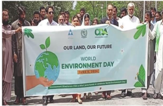
ISLAMABAD: Celebrating World Environment Day 2024: Pakistan Poverty Alleviation Fund (PPAF) and Environment Directorate of Capital Development Authority (CDA) Islamabad jointly organized a walk to raise awareness on climate change.